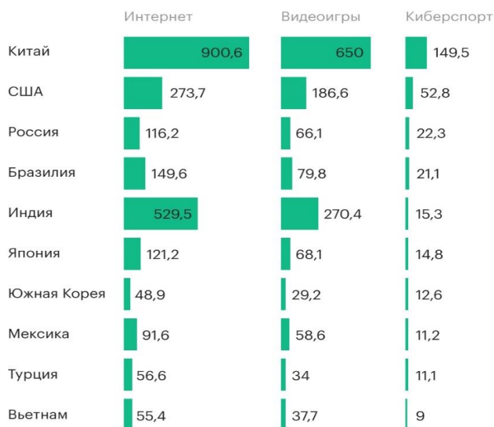
Рис. 3. Размер аудитории по киберспорту (млн. человек) [8]

5. Рынок киберспорта за несколько последних лет совершил стремительный рывок от небольшой рыночной ниши до огромной медиа-отрасли, аудиторией которой стали сотни миллионов человек по всему миру.