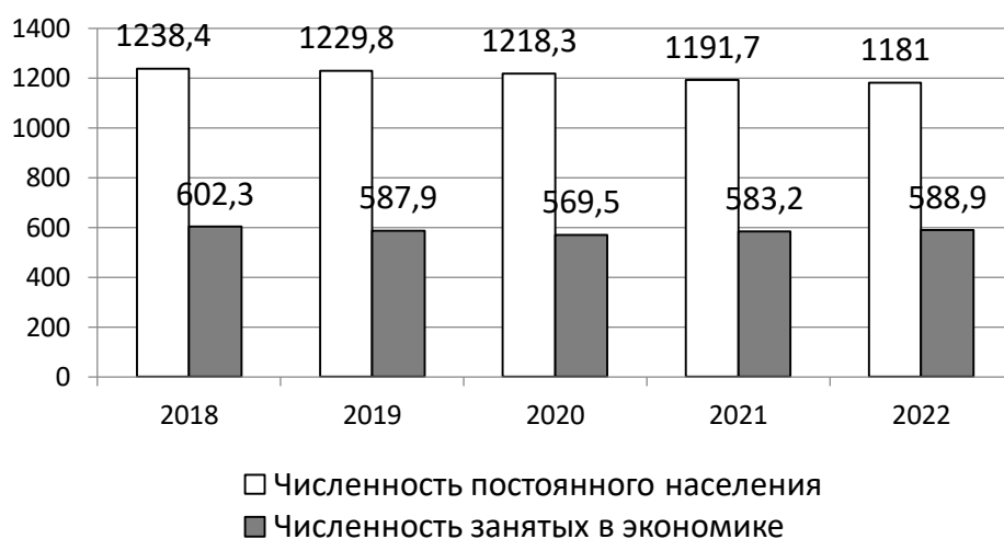
Рис. 1. Динамика численности населения Ульяновской области, тыс. чел.

Одной из главных задач молодежной политики является обеспечение доступа молодых людей к образованию и профессиональному развитию. Проведённый нами в Ульяновской области социологический опрос показал значимость социально-экономических условий региона для профессионального самоопределения старшеклассников, построения ими образовательной стратегии [4, с. 120]. Выбирая вуз, выпускники школ учитывают, в числе других факторов, качество жизни в регионе.